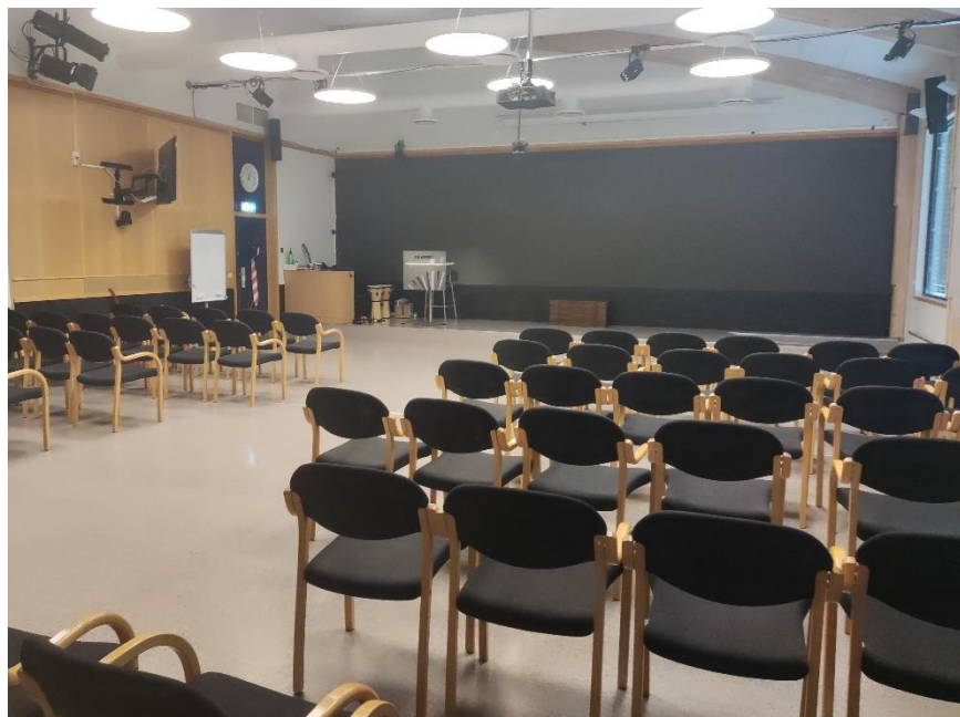
Фигура 4. Конферентна зала в центъра Frambu

Но дейностите във Frambu оставят най-силни впечатления от цялата среща с центъра. В рамките на посещението имаме възможността да станем част от публиката на една от най-любимите за юношите части от програмата: всяка година, за участниците в лагера се провежда официален турнир по футбол. Гости в този турнир е един от най-престижните отбори в Норвегия, в който участват играчи от националния отбор, тренирани от бивш треньор на националния отбор. Тези играчи влизат във вълнуващ мач с децата с редки диагнози: