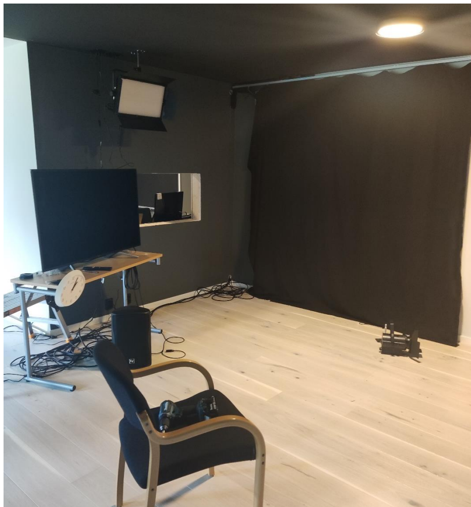
Фигура 3. Студио за видеозаснемане в центъра Frambi