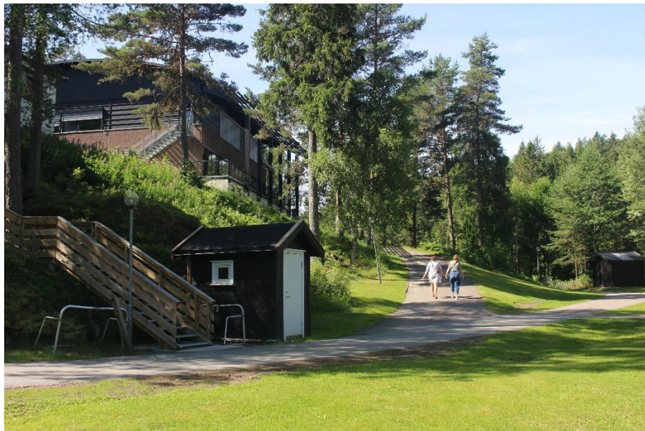
Фигура 2. Пътека към страничния вход на Frambu

А с влизането в самата сграда, незабавно прави впечатление многобройния екип на Frambu – въпреки краткия летен сезон в страната и очакването, че голяма част от персонала ще бъде в летен отпуск, в центъра кипи усилена работа по провеждането на летния лагер.