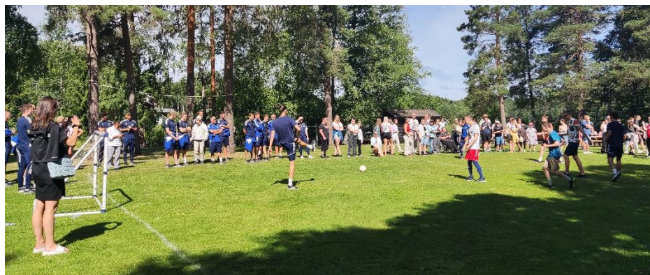
Фигура 5. Футболен мач между участници в летния лагер на Frambi и национални играчи на Норвегия

След конкурентна игра, отборът на Frambi бележи славна победа, а гостуващият отбор се оказва достатъчно отзивчив, за да даде кратко интервю на нашата организация относно мотивите и удовлетворението от това да бъдат доброволци в подобно събитие: