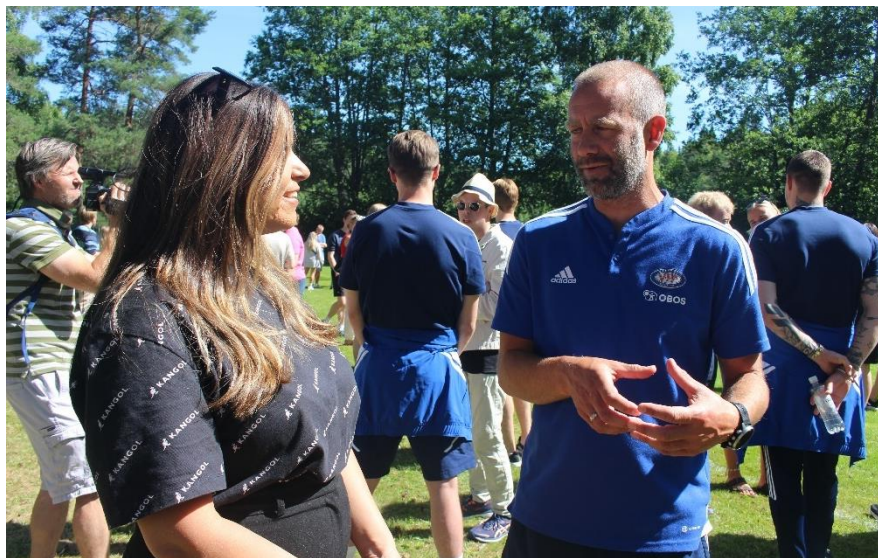
Фигура 6. Интервю за БХА с треньора на доброволстващия отбор по футбол на Норвегия

След конкурентна игра, отборът на Frambi бележи славна победа, а гостуващият отбор се оказва достатъчно отзивчив, за да даде кратко интервю на нашата организация относно мотивите и удовлетворението от това да бъдат доброволци в подобно събитие: