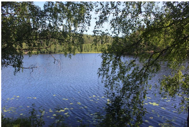
Фигура 1. Кадър от езерото Brokkenhustjern на входа на Frambu

Първите стъпки в околността на центъра разкриват колко важен е подбора на място за предоставяне на качествени и ефективни социални и здравни услуги – запазената природа, в която сградите на Frambu са разположени и богатите ресурси, с които разполага са незаменима предпоставка за гладко протичащата работа на екипа и предизвикването на трайна промяна в психичното благополучие на посетителите: