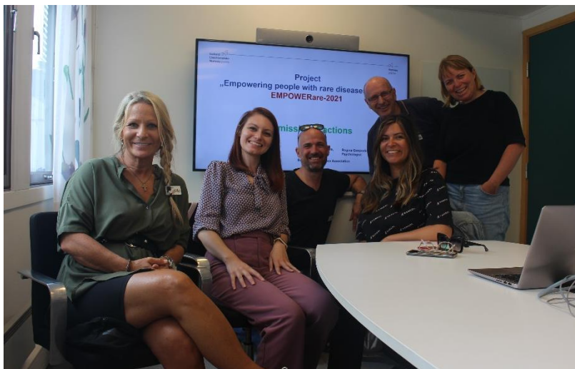
Фигура 8. Среца между екипите на БХА и Frambu

В резултат от тази среща бяха обсъдени перспективите за бъдеща съвместна работа, бяха дадени нови идеи за услуги и кампании, които могат да се внедрят в България, а една от бъдещите срещи между БХА и Frambu – с цел планиране на съвместни изследвания – беше уговорена още на място.